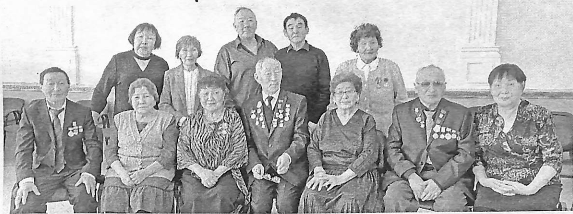
Киинэ бэтэрээннэрэ. ААПТАР ТҮҮЭРИИТЭ.

СӨ Ил Дархан уонна Бырабытталыстыбатын пресс-сулууспата.