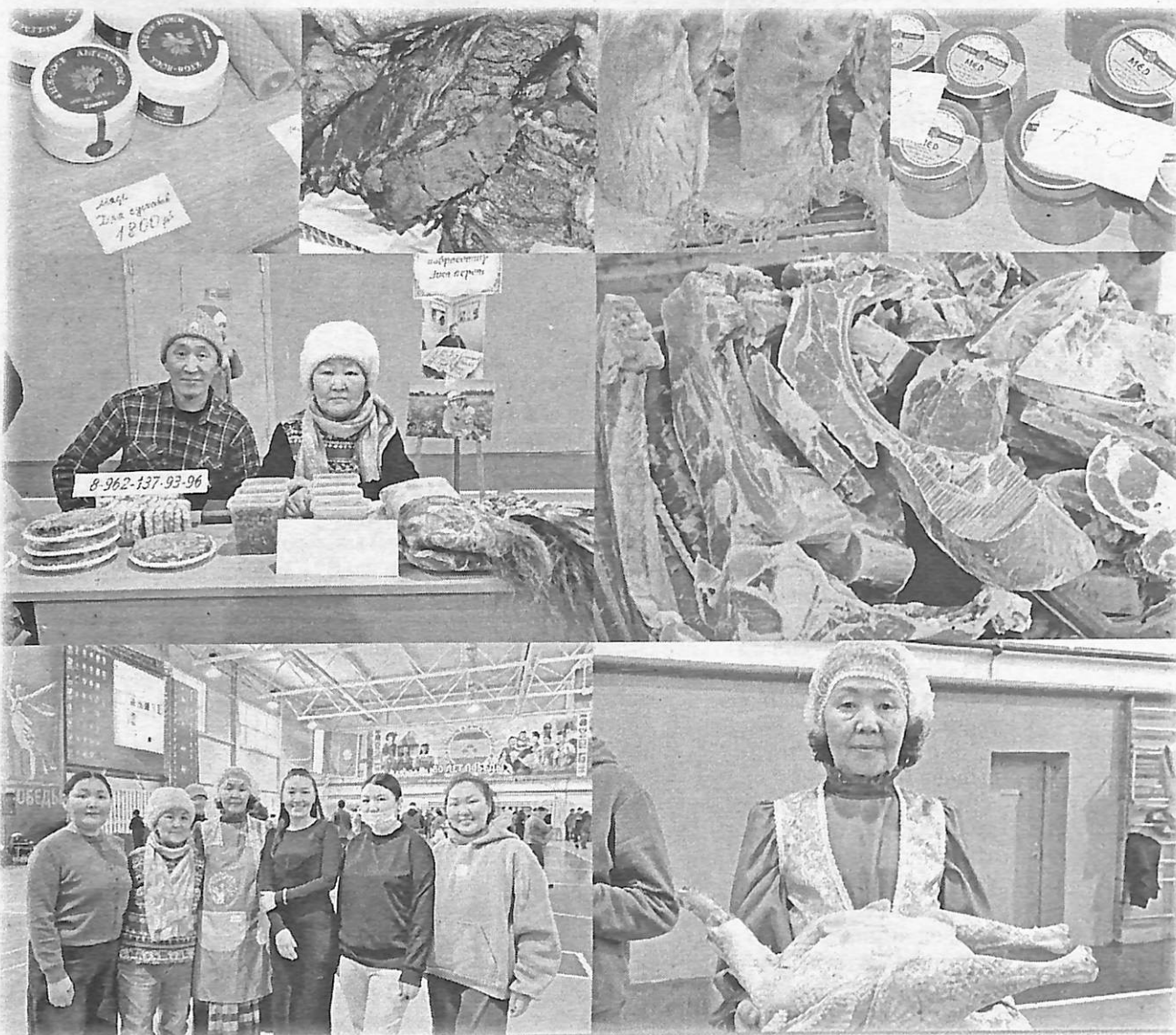
Социальной хантараагынан туһанааччылар араас таһымнаах быыстапкаҕа кытталлар.

Тирэх. Быйылгыттан Судаарыстыбаннай көмөнү ылыы усуллубуйата кэнээтэ/3