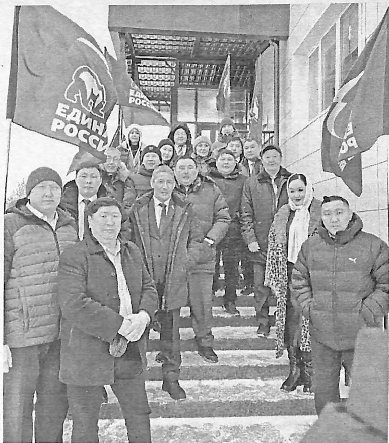
Мэнгэ Хангалас оройуонугар Чурапчы улуунун дэлэгээссийэтэ.

Биһиги улууспутугар кэнники биэс сүл иһигэр «Биир ньыгыл Арассыыйа» баартыя көмөтүнэн Е.А. Борисов аатынан библиотекэ-архыып, А.К. Софронов аатынан культурунай-спортивнай комплекс, П.Н. Сокольников аатынан киин балыһа иккис учураата, Алабар