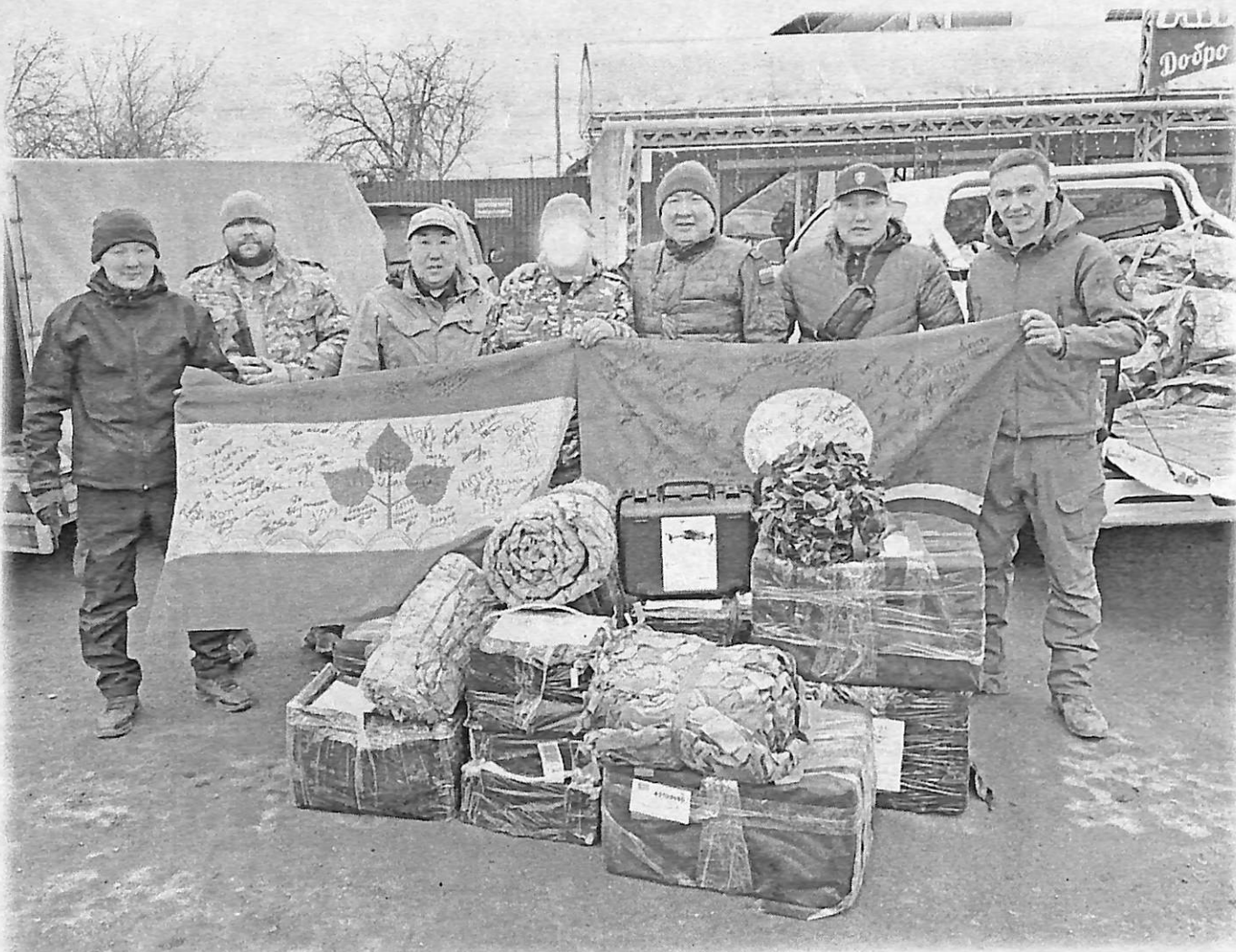
Гуманитарнай көмөнү туттарыы түгэнэ.

Тыл салайааччыга. Чурапчы улуунун дэлэгэссийэтэ олунньу 26 - кулун тутар 8 күннэригэр байыаннай дьайыы буола турар сирдэригэр, Арассыыйа санга территорияларыгар 15-с уочараттаах командировкаларыгар баран кэллилэр/3