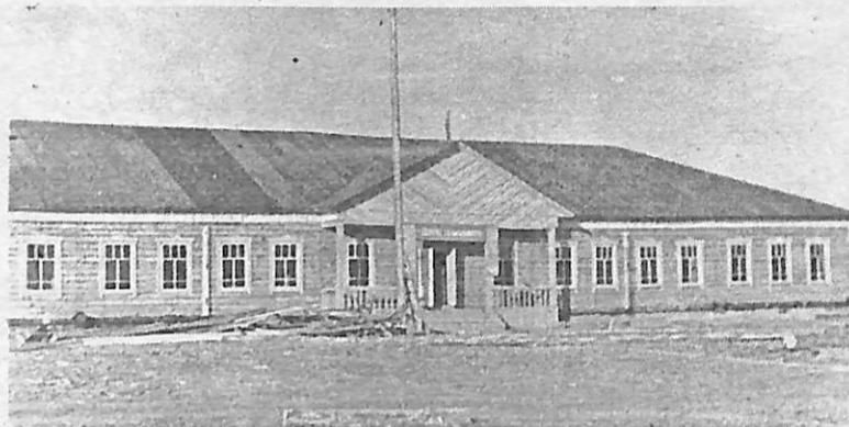
Балаҕан ыйын 1 күнүгэр 1956 сыллаахха Мугудай орто оскуолата аһыллыбыта.

Мугудай оскуолата Национальнай кэнсиэпсийэни олоххо киллэриигэ ылсан үлэлээбитэ, инновационнай үлэҕэ бастакынан өрөспүүбүлүкэҕэ экспериментальнай былаһаакка буолбута, Норуоттар икки ардыларынааҕы ЮНЕСКО кэмпириэсийэтэ ытыллыбыта, Ивановтар “Баҕа санаа” ааптарыскай оскуолата грант ылбыта, оҕо толкуйдуур дьо-