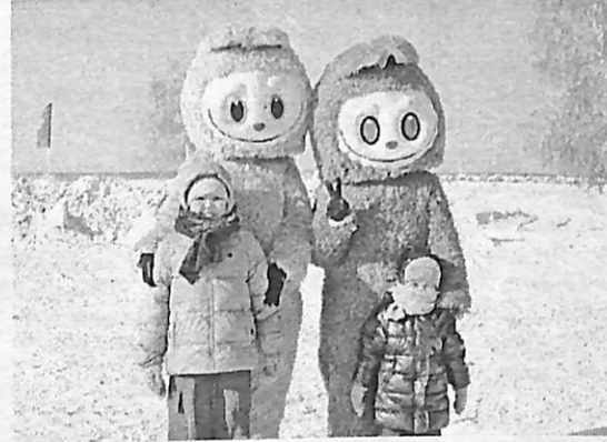
Даптар хаартыскага түһэриилэрэ.

суох үктэл оҕоһуллубуттар, сырылыыр сир балай эмэ үрдүк, уларсыкка аналлаах батуттар, ледянкалар бааллар. Сыл ытарга анаан араас көрүҥ автоматтар, бэстилиэттэр бааллар. Икки көрүҥ буран оҕолору хатааһылатар, ону аһан баггилар эмиэ сүүрэллэр итиэннэ ханкылыырга сөптөөх көбүс-көнө, олус киэн каток арылынна.