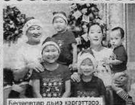
Беляевтар дьиз кэргэттэрэ.

Үгүс ыал бэйэтэ тутуһар араас үгэстээх, сизэрдээх – туомнаах. Халобура, дьиз кэргэнинэн биригэ айылҕаба сылдыһы, бэлэз күннэри бэлэтиээһин уонна да атын. Бу дьиз кэргэни түмэр уонна сомоҕолуур.