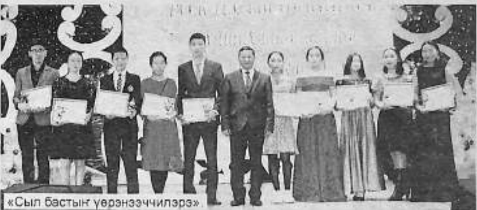
«Сыл бастын үөрэнээччилэрэ»