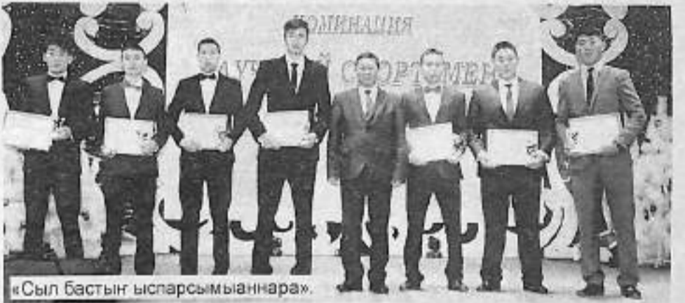
«Сыл бастын ыспарсымыаннара»