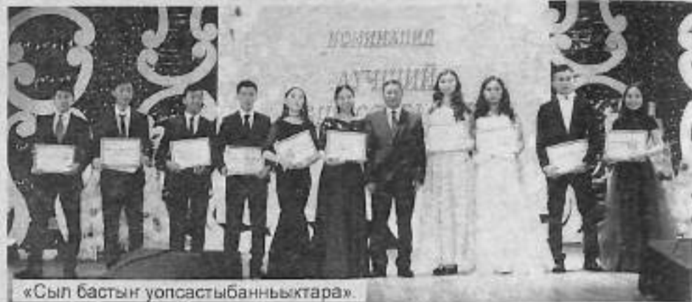
«Сыл бастын уопсастыбанныктара»

Ахсынньы 16 күнүгэр «Айылгы» култуура уонна духуобунай сайдыы киинигэр Чурапчы улуунун бастын үөрэнээччилэригэр аналлаах Ороһуоспатаабы баалытылынна. Бырааһынньыкка бастын көрдөрүүлээх, актыбыыс, үөрэххэ, наукаба үрдүк ситиһиллэрдээх улууспут инники кэскиллэрэ, кизн туттар оболорбут ыгырыллан, тобуоруһа муһунулар.