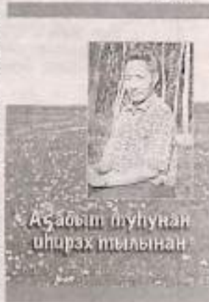
Аҕабыт туһунан иһирэх тылынан

Мустубут дьон эбэ эмиз соһотун сайыны сибийэй