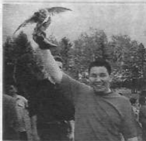
Булт туйунан кэлсээ диэтигит дуу?

Дьэ, ол туйунан баҕас кэлсээн бөҕө буоллаҕа дии. Баччаанна диэри ардактан-хаартан, эмээхсин сирэй-харах анһыарыттан, кэнники кэмнэ харчы да кырымчыгыттан иннибэккэ, Сахабыт сирин хара тыатын, хайатын тэлсэ сатаан бизрديم ини, бизрбэтим ини. Чэ, онон, салгымтыалаах соҕус да буоллар, кэлсээмин саҕалыым. Бука, саҕалаатарбын эрэ тохоторгуттан соло булбаккыт буолуо. Һэ-Һэ, чэ, ити хаалпын.