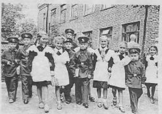
Аба дойду сэрмитин кэнниттэн, 1948 с., оскуола

Арасыйыба оскуола пуормата 1834 с. баар буолбута. Уолаттар байыаннай мундирга майгынныры, оттон кыргыттар кыра хара баартыктаах, сизхтээх уһун харана куҕас былаачыйаны кэтэпээрэ. Бырааһынныкка былаачыйа маҕан баартыктанара, куруһуба саҕаланара. 1918 с. оскуола пуорматын суох ҕыммытара.