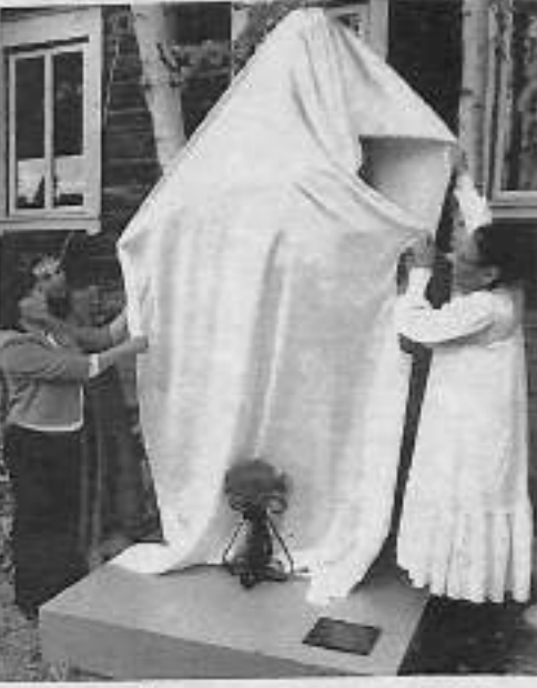
туһунан санааларын атаастастылар.

Эбиэттэн кизгэ Арыылаах орто оскуолатын аактабай саалатыгар «Наследие Т. М. Каженкина в развитии духовности и образования в РС(Я)» диэн төгүрүк остуол ытытылына. Бастагынан Танара дьизтин өрөмүөннээн, чөлүгөр түһэри туһунан болпурус көтөбүлүннэ. Маныаха баҕа өттүнэн көмөлөһөр дьонтон харчыны хомуйуу уонна араас таһымнаах граннарга кыттыы туһунан кэпсэтилэр. Оттон иккис болпуруоһунан нэһилиэк устуоруйатын уонна Танара дьизтин аттыгар кимнээх көмүллэ сыгалларын үөрэтэргэ Арыылаах, Дьүлэй, Игидэй, Кытаанах, Таңда нэһилиэгин оскуолаларыгар көрдүүр-чинчийэр эгэрээттэри тэрийии туһунан буолла. Үсүһүнэн Танара дьизтин оруола нэһилиэнньэҕэ үрдүүрүн туһуттан община тэрийэн, танара үлэһиттэрин ыгыран, араас пизксийэлэри ыттарар