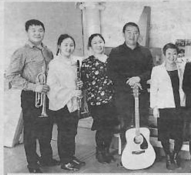
Утуйааччылар сана кэлбит үнүстүрүмүөннэрин кытта