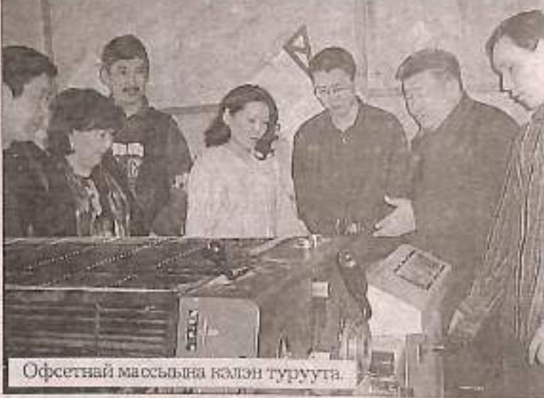
Офсетнай массынна кэлэн турууга.

Гаврил Гаврильевич саҕалаабыт дьыалата салһанар. Тэрилтэтэ сыллата үүнэр-сайдар, үлэлиир кыаҕа эбиллэн иһэр. Салайааччыбыт аатын ааттар сыйлан "Сага олох" редакционнай-издательскай холбоһук сага дьизитигэр кини аатын иһэрэн "Хаһыат дьизэ" диин ааттаан үлэрэ, кыайыыларга кынаттанарбыт буоллар табыһастаах буолуо этэ.