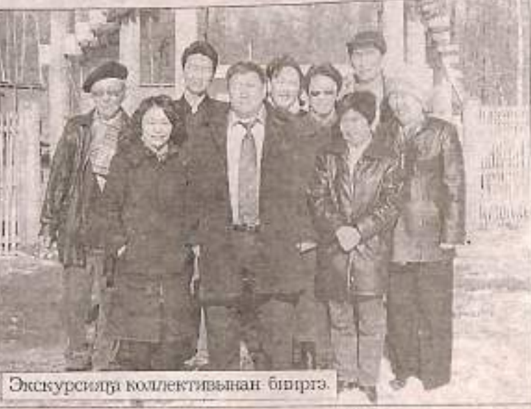
Экскурсия коллективинан биһирэ.

киһи диэтэххэ, арааһа, сыһыспыт буолуо. Ол курдук, чугас дьонугар, доһотторугар итин сыһыаннааҕа, үтүө сүбэни эдэр да, саастаах да дьонго түнгэтэн дьону олоххо сырдык, үрдүк суолтаны биэрэллэригэр угуйара. Кинини кытта араас тизмэҕэ барытыгар кэпсэтэн киһи дуоһуйуу ыллара. Мин бэйэм быыс булларбын эрэ аҕа табаарыһым диин киирэн элбэҕи сүбэлэтэrim Гаврил Гаврильевич талаана суруйуу уонна салайыы эйгаларинэн мугурдаммата. П.М.Решетников аатынан Чурапчытааҕы народ-