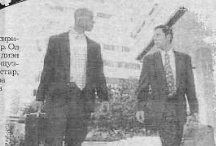
Французскайдыы уонна английскайдыы кэпсэтиигэ самай туттуллар этикет уонна тыллар

сайдьыт сирин ааттыллар. Ол эрэн, "этикет" дигэн тыл төһө да французскай тылтан табытар, саага культура үөскээбинэ Италияга сараламмыта. 15-с үйгө Европа дойдуларыгар бэйэ икки ардыгар сэриллэһин, феодалнай тутул, сэриллэлтэри, буйуунары эрэ өрө тутуу, науканы сэргэ төлөһү бара турданына, Италияга саага культура үөдүйбүтэ. Манна, атыттары кытта тэннээтэххэ, үөрэхтээх, баай дьон үгүс этилэр.