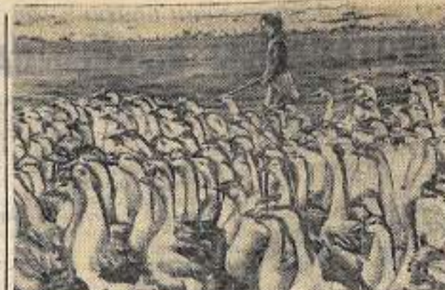
Монголи. Хааны нитни дойдуга арийах ороску-тунай улахан барьгы биэрэр дьохунаах салаан буолар...